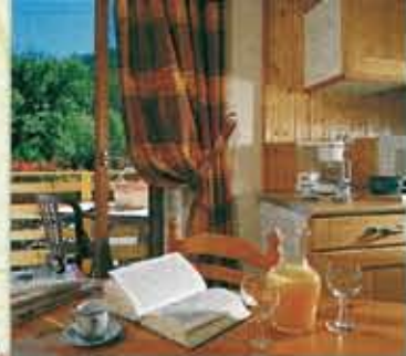
STUDIO AVEC BALCON

Vacances dans un écrin de verdure de 3 hectares